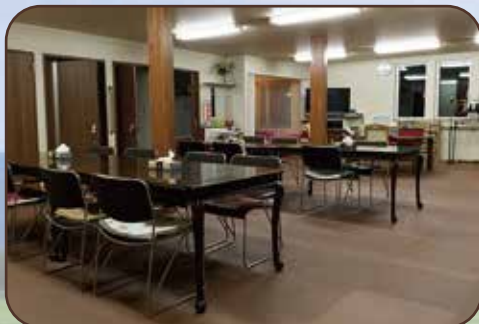
床にはクッション材を敷き詰めています。足・膝・腰に優しく、安全です。

畑では、あなただけの野菜の苗を育てられます。収穫した野菜は、その場で食べることも、持ち帰ることもできます。