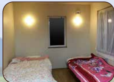
リラックスできる静養室