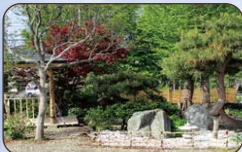
四季折々の表情を見せる日本庭園(写真左・東屋)