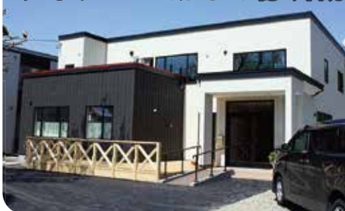
バルコニーでの屋外食もあります